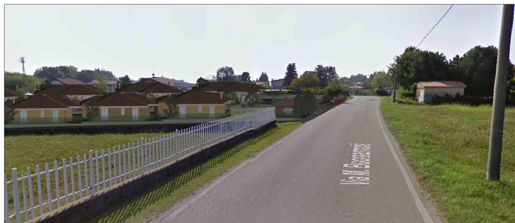
FOTOINSERIMENTO SU VIA BUONARROTI ( DOPO)