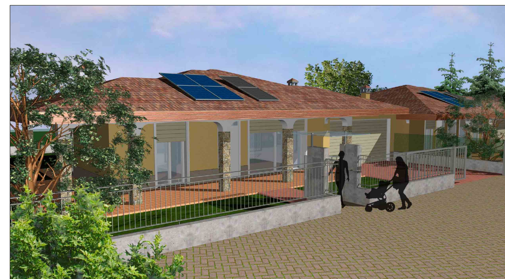
VISTA VILLETTA N° 1