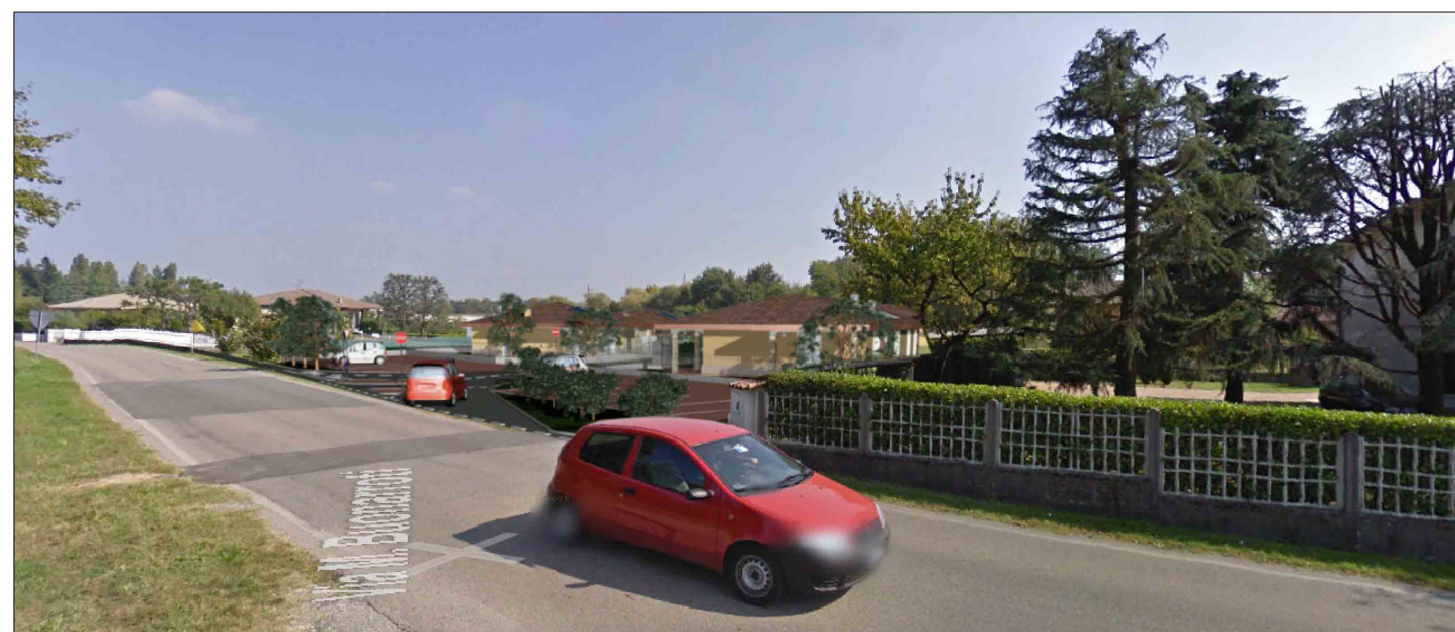
FOTOINSERIMENTO SU VIA BUONARROTI ( DOPO)