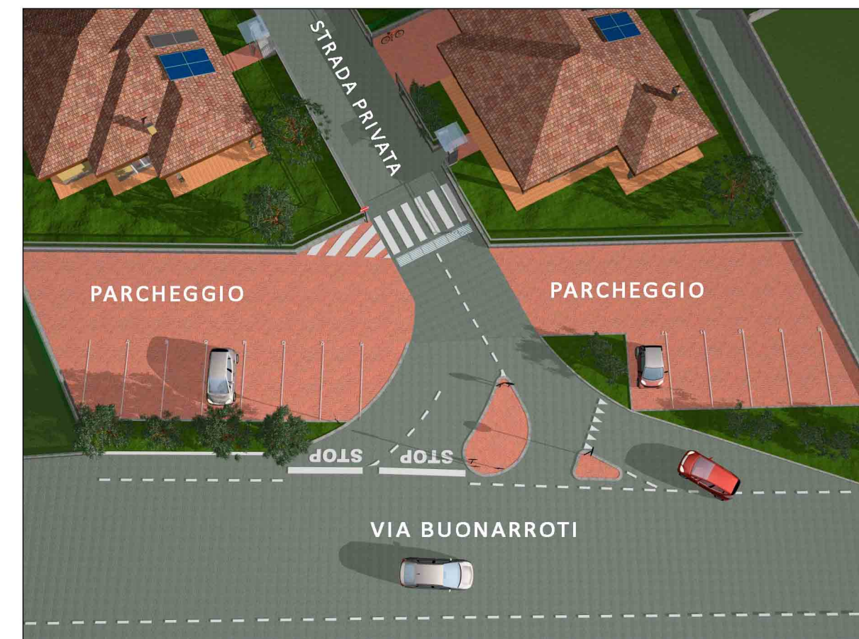
PARTICOLARE INGRESSO E ZONA PARCHEGGIO