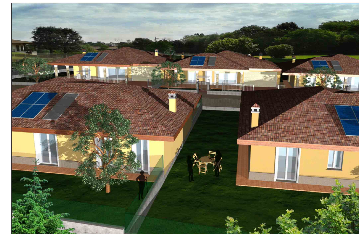
FOTOINSERIMENTO DELLE VILLETTE VISTA SUD/NORD