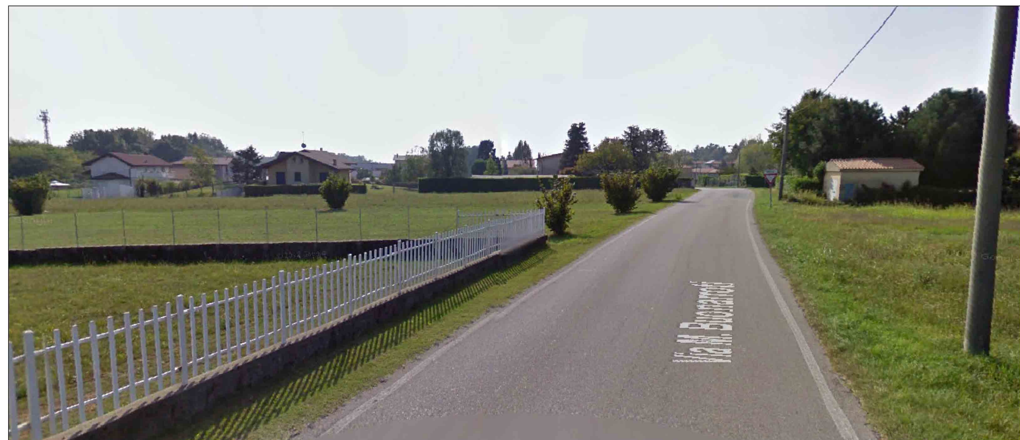
FOTOINSERIMENTO SU VIA BUONARROTI ( PRIMA)