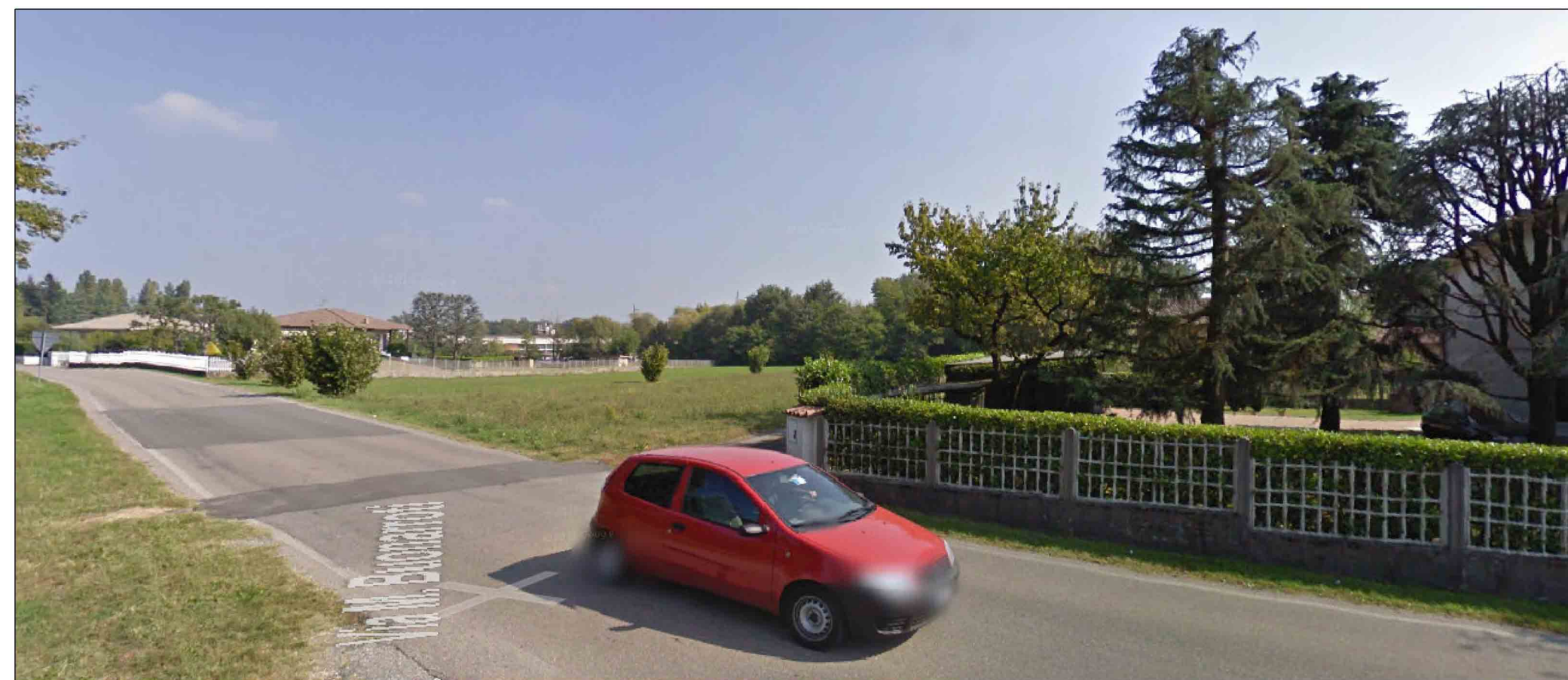
FOTOINSERIMENTO SU VIA BUONARROTI ( PRIMA)